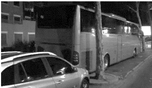
Aire de stationnement nécessitant une manœuvre complexe