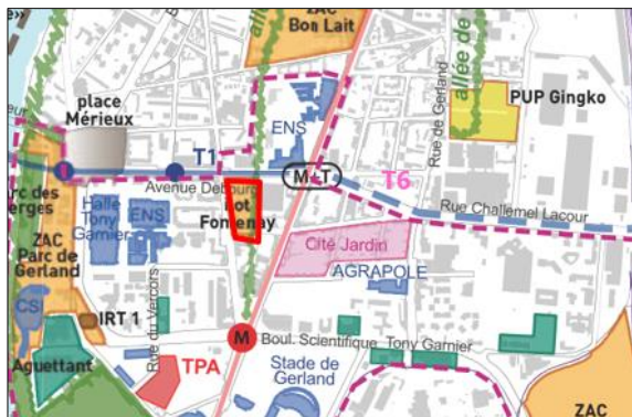
Le projet dans son contexte