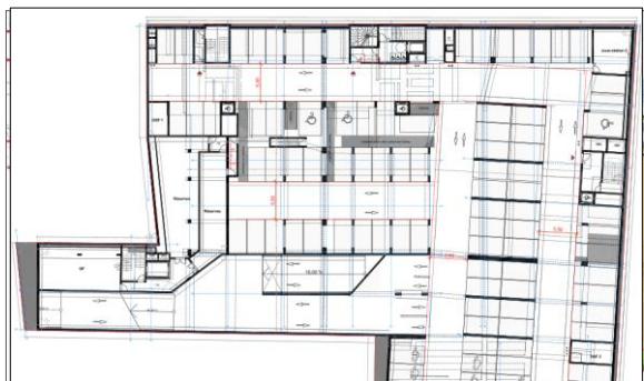
Extrait plan du parking accessible au public