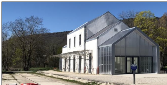
L'ancienne gare de Divonne-les-Bains