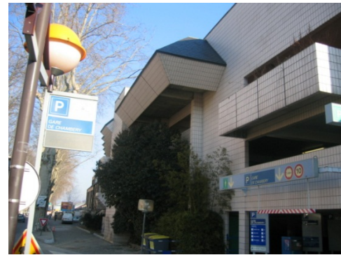
Parc relais de Chambéry