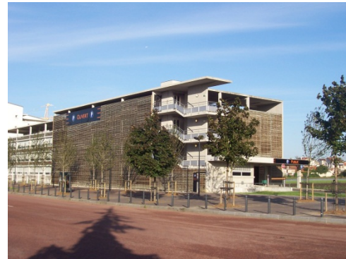
Parc relais de Saint Denis Université